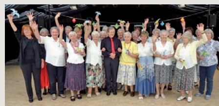
Tanzgruppe aus Rätzlingen