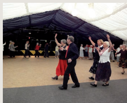
Alle sind dabei