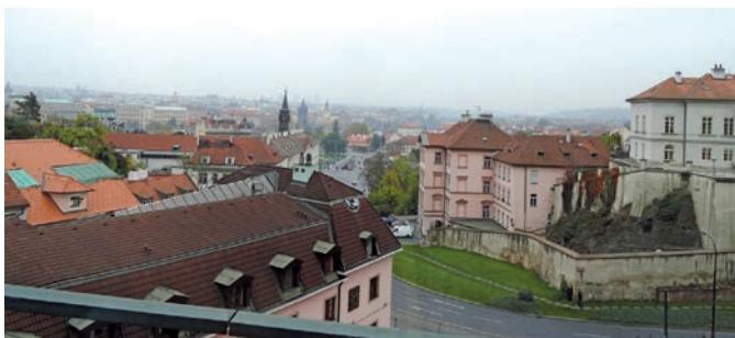
Aussicht auf einen Teil von Prag