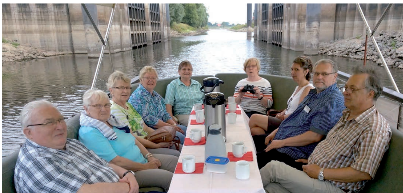
Fleißige Bienen on tour