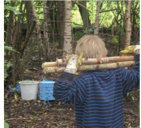
Bei der Arbeit