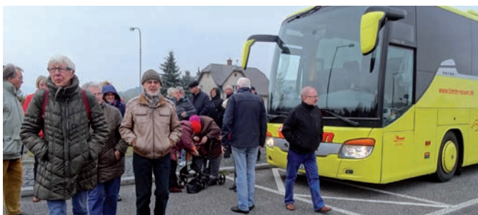
Die Fahrt beginnt

Die Kamenice, die nach 35 km mit einem absolutem Gefälle von 13,4 %o in die Elbe fließt. Dieser Fluss zeichnet sich besonders durch seinen Fischreichtum aus, vor allem Lachs. Wir wanderten einen romantischen Pfad zur „Wilden Klamm“, erlebten eine Kahnfahrt bei der uns ein Wasserfall auf Knopfdruck vorgeführt wurde. Na denn, den ganzen Weg wieder zurück. Und dann Prag, wie schön!