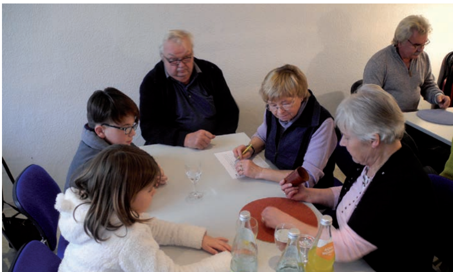
Mehrere Generationen beim Spiel