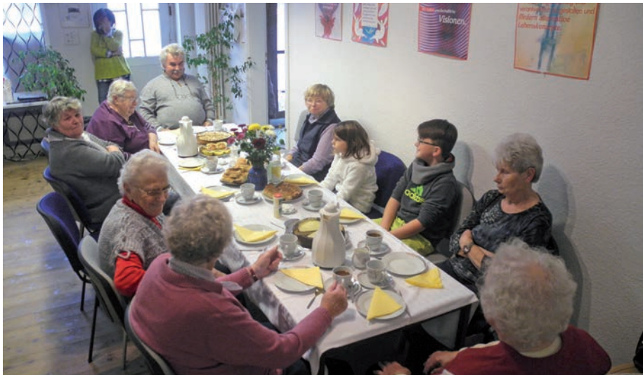
Erst eine Stärkung