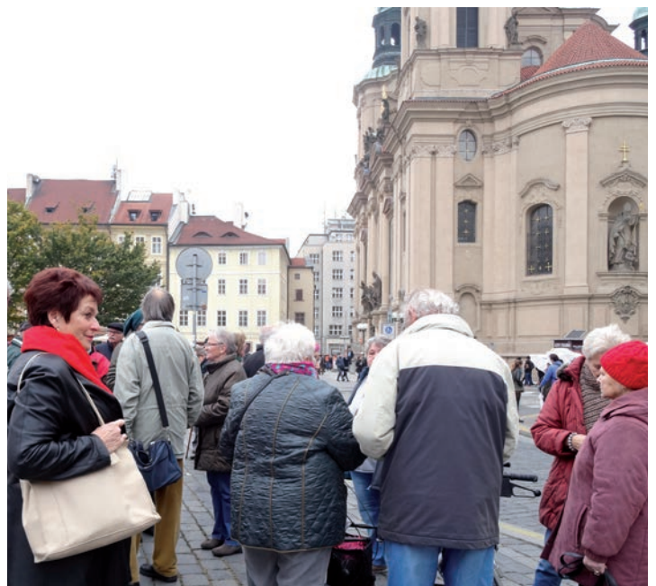
In Prag und los gehts